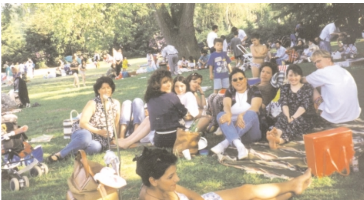
Día Familiar del CIMA en el Stadtpark de Hamburgo. Mayo de 1999.